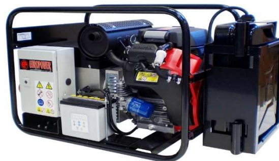
EP13500TE/TE AVR EP16000TE/TE AVR EP18000TE/TE AVR