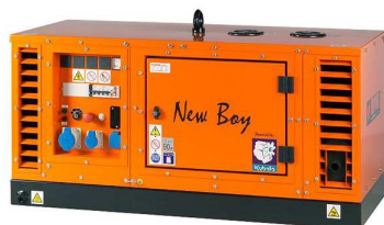
EPS113TDE / EPS183TDE