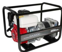
EA3000 / AVR