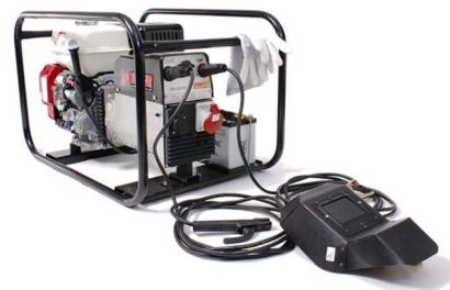
EP200X1 / (FULLOP)