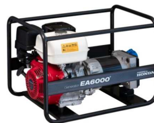
EA6000 / AVR