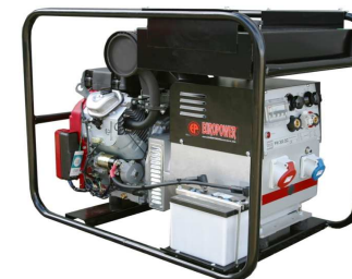
EP250XE / 300XE